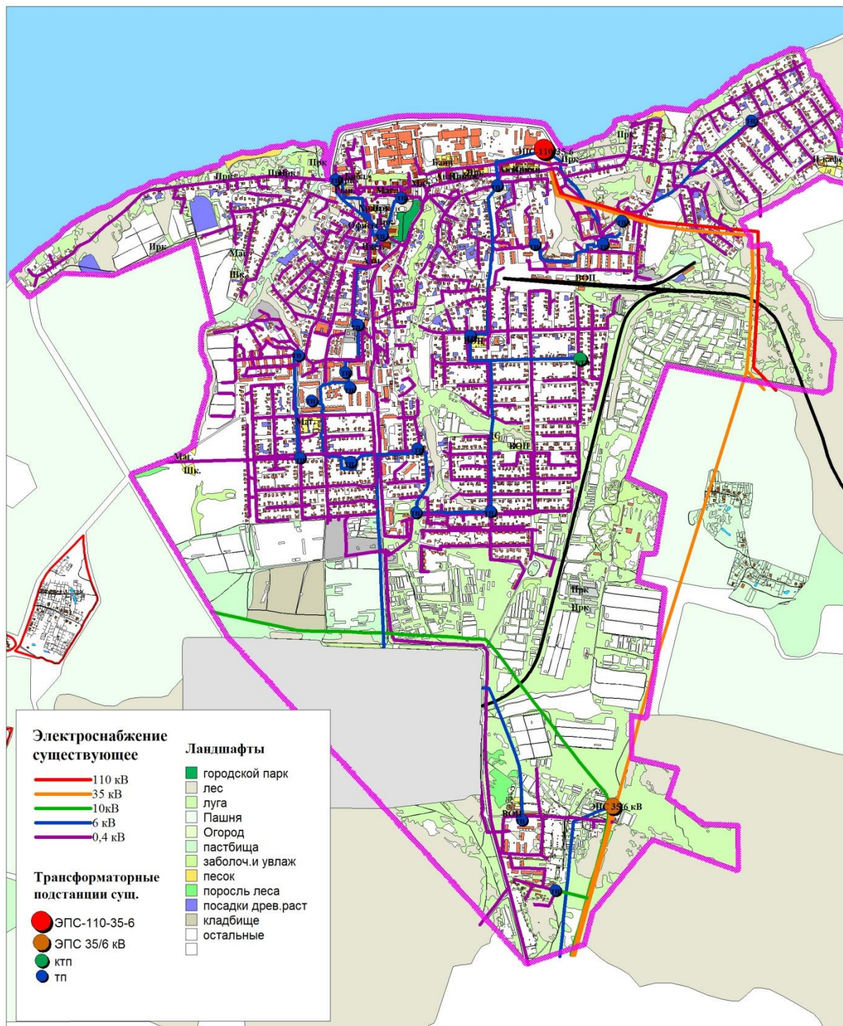
Рисунок 1. Схема электроснабжения г. Наволоки