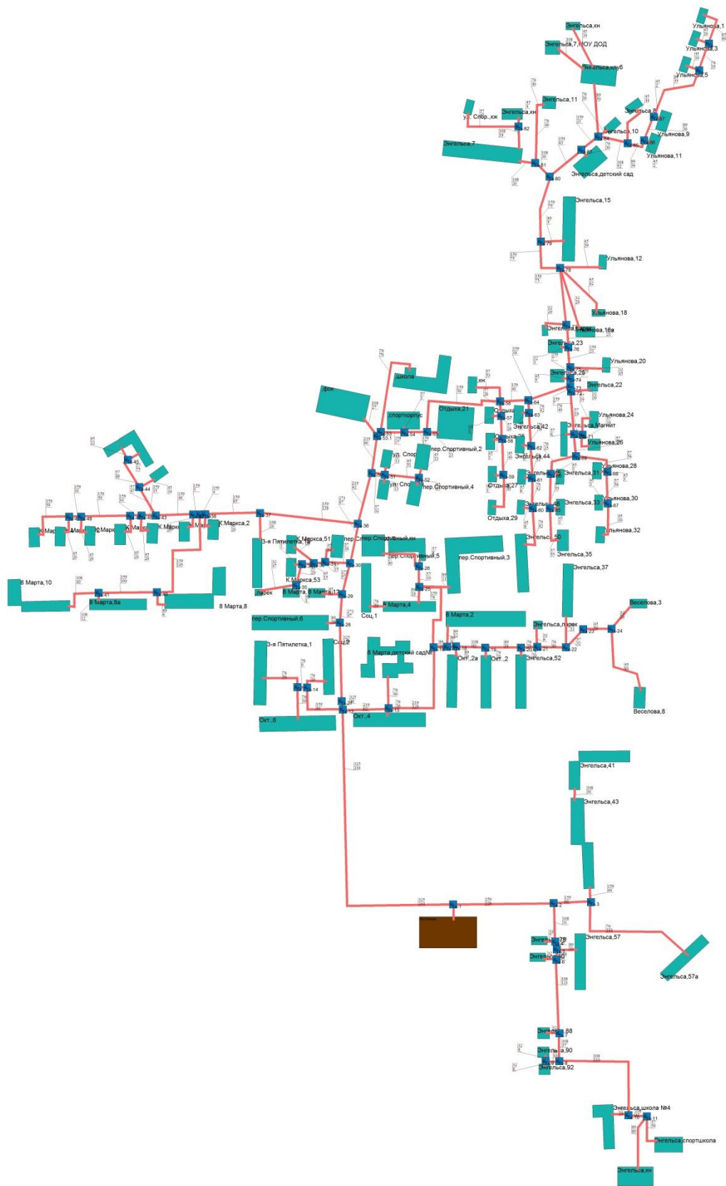
Рисунок 3 - Расположение источника тепловой энергии котельной Квартала Б.