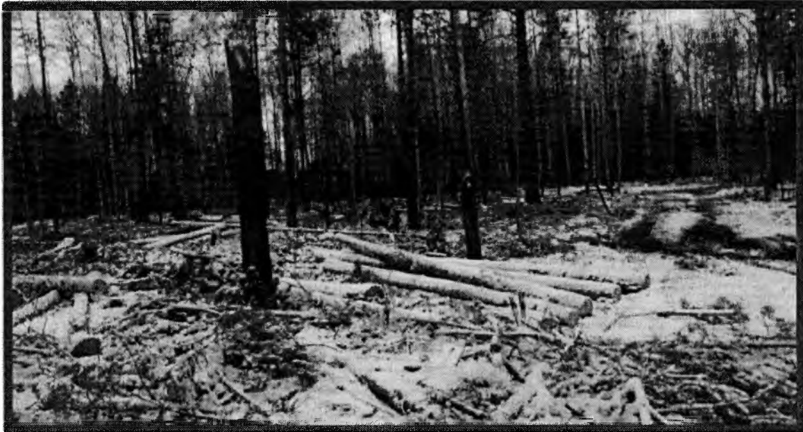
Изображение № 7 Брошенная древесина вдоль лесовозных дорог. Не является валежником