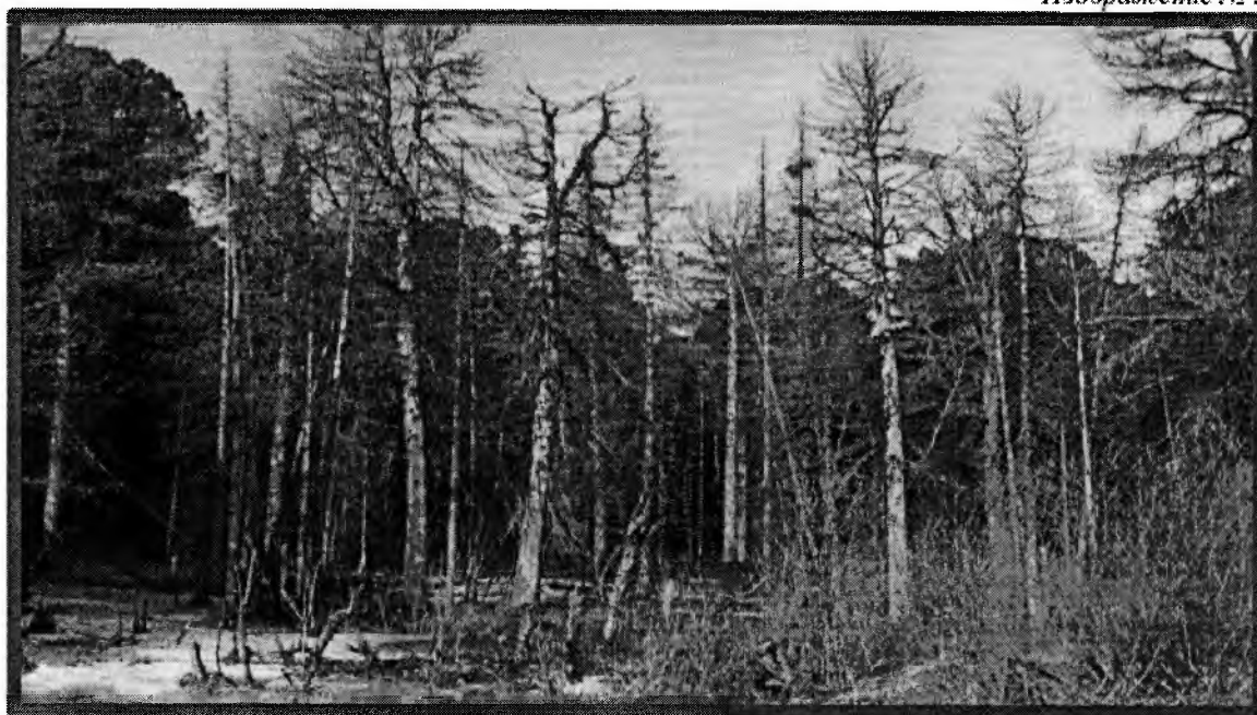
Изображение № 4 Сухостойное дерево. Не является валежником Изображение № 5

Кроме того, необходимо обратить внимание, что деревья, которые лежат на земле, но не имеют признаков естественного отмирания (имеют зеленую листву или хвою), определять как «мертвые» не допускается ( смотри изображение № 5 ).