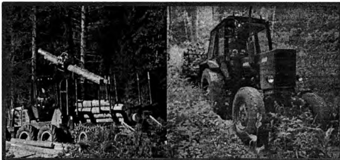
Изображение № 9 Специализированная техника. Использование для заготовки валежника запрещено

При заготовке валежника не допускается повреждение почвенного покрова, подроста и молодняка ценных пород, лесных культур.