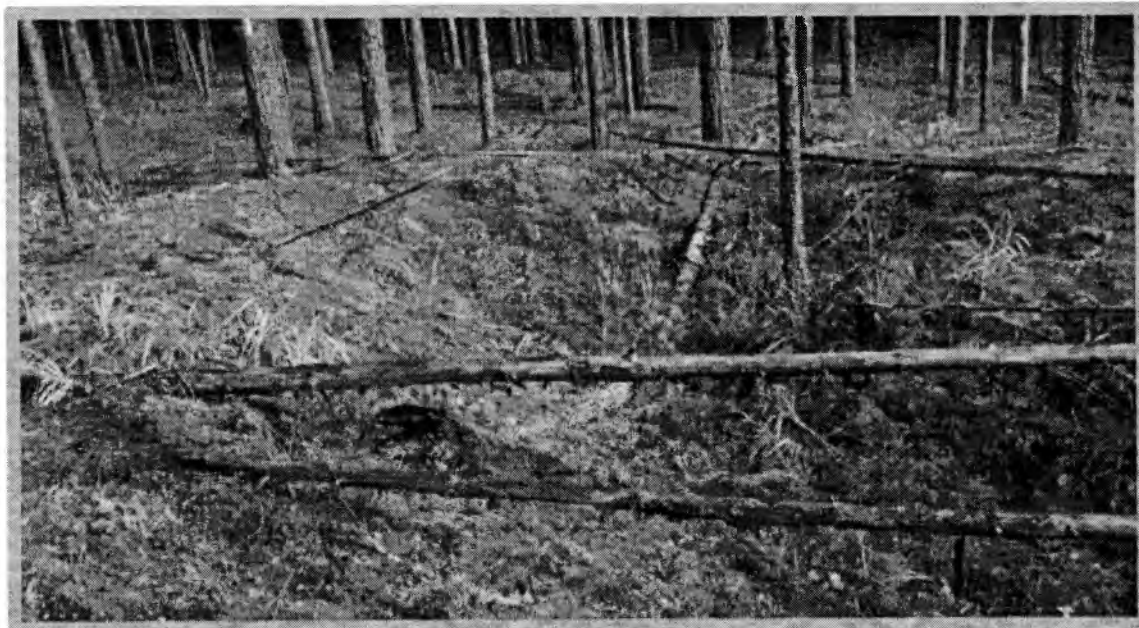
Изображение № 1 Валежник

Примеры валежника (смотри изображения №№ 1,2,3).