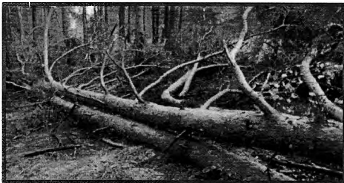
Лежащее на поверхности земли ветровальное дерево, не имеющее признаков отмирания. Не является валежником

Кроме того, необходимо обратить внимание, что деревья, которые лежат на земле, но не имеют признаков естественного отмирания (имеют зеленую листву или хвою), определять как «мертвые» не допускается ( смотри изображение № 5 ).