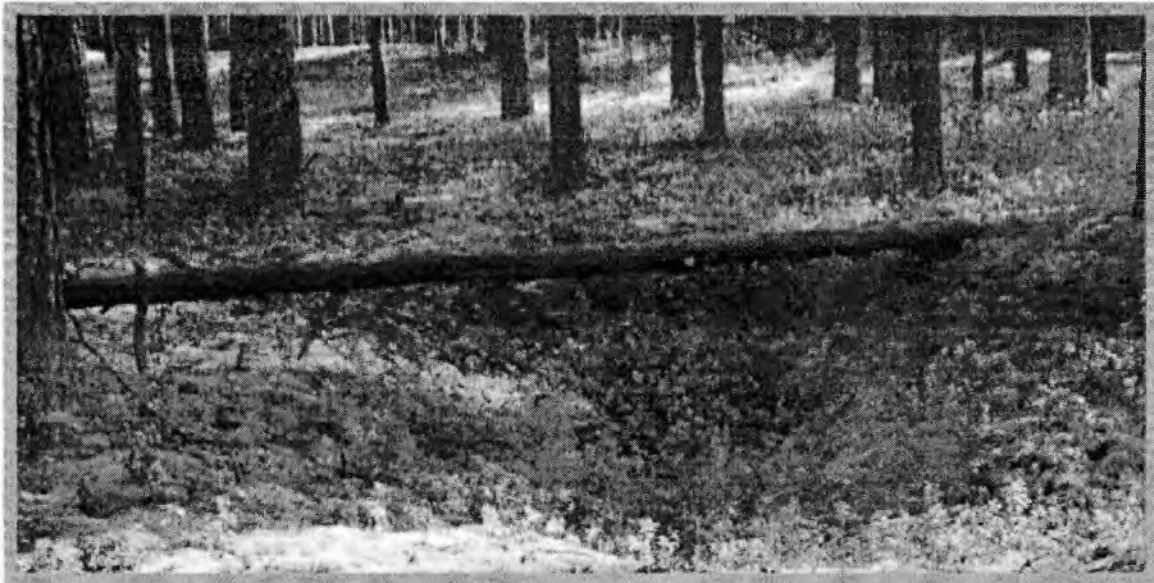
Изображение № 3 Валежник